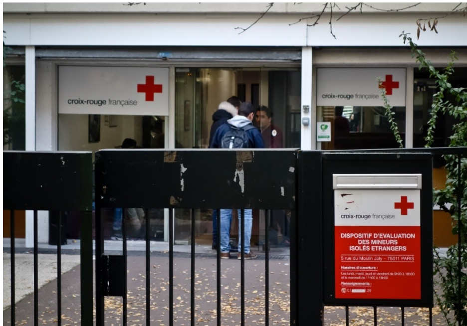
Un mineur se voit refuser l'accès au DEMIE, le 3 janvier 2017

de la Chapelle où ils ne peuvent être hébergés en raison de leur minorité. À de nombreuses reprises, les membres de l'ADJIE se sont rendus au DEMIE et ont pu constater cette pratique manifestement illégale.